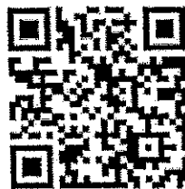
MV เพลง “ในอุ่นอ้อมอกมันคง”