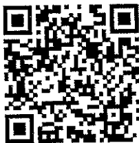
สิ่งที่ส่งมาด้วย

สำนักงานจังหวัดศรีสะเกษ กลุ่มงานยุทธศาสตร์และข้อมูลเพื่อการพัฒนาจังหวัด โทรศัพท์/โทรสาร. ๐ ๔๕๖๑ ๑๑๓๙